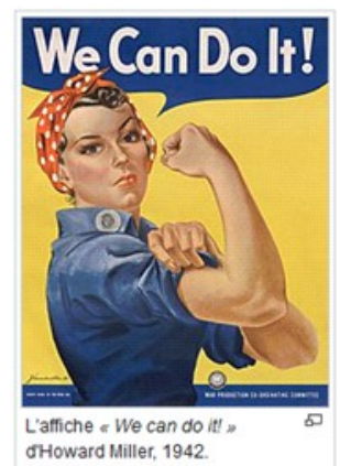
L'affiche « We can do it ! » d'Howard Miller, 1942.

Petit point d'histoire : c'est en 1942, dans le cadre d'une campagne orchestrée par l'industrie de l'armement pour encourager l'enrôlement des femmes dans l'effort de guerre, qu'apparaît une femme en bleu de travail, bandana rouge noué sur la tête et sur son visage l'expression de sa conviction « we can do it ! ». Elle est alors l'image parfaite de la femme blanche séduisante qui va remplacer son mari parti au combat !